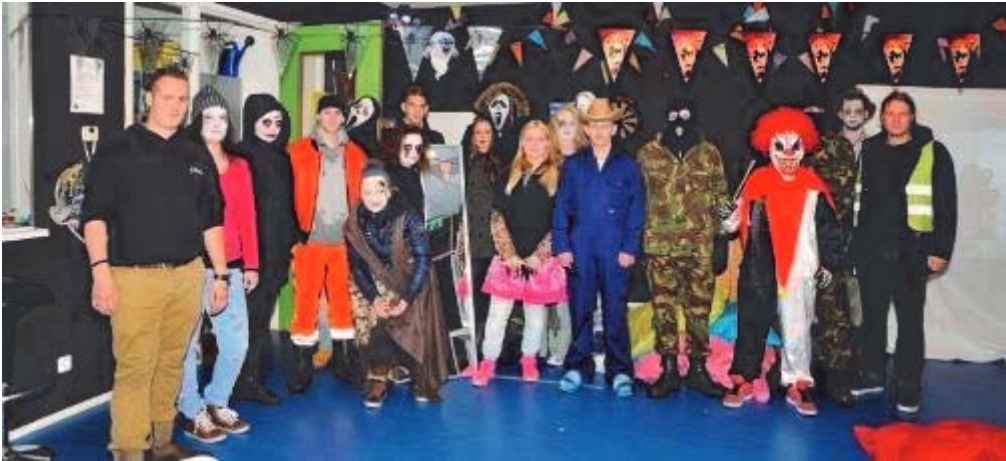
Boven: De medewerkers klaar voor de start, onder: veel deelnemers en veel ouders en begeleiders