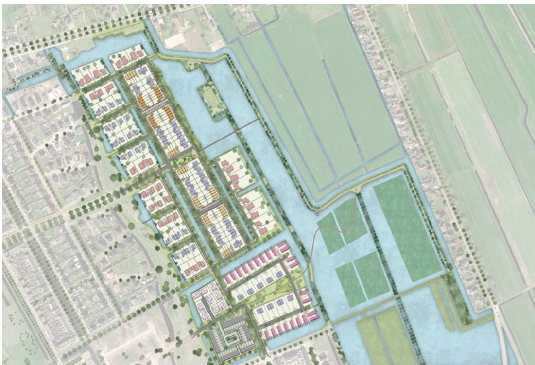
Plankaart noordoostkant Skoatterwâld

Neem gerust contact op met Corina Neelis, projectleider gemeente Heerenveen, via telefoon 14 0513 of c.neelis@heerenveen.nl